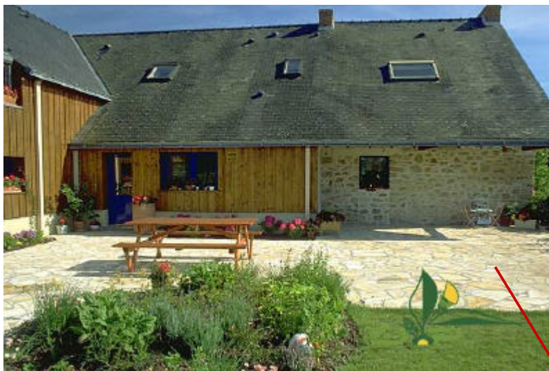
Exemple de dallage en opus incertain