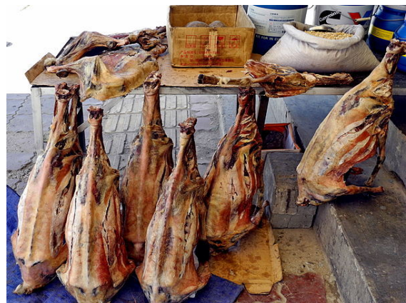
mouton séché des hauts-plateaux tibétains