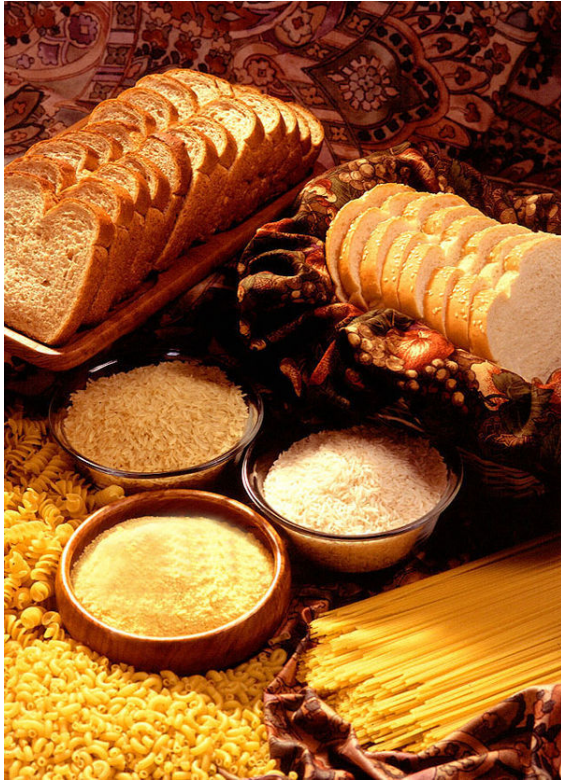
Quelques céréales alimentaires et des produits qui en sont dérivés : grains à cuisson, pain, pâtes alimentaires.