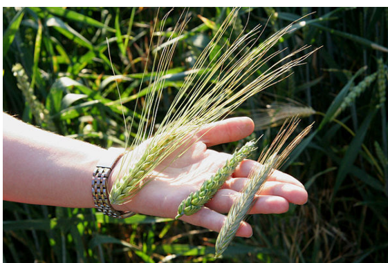
Épis d'orge, de blé et de seigle

Une céréale est une plante cultivée principalement pour ses grains, c'est-à-dire ses fruits (caryopses), utilisés dans l'alimentation de l'Homme et des animaux domestiques, souvent moulus sous forme de farine raffinée ou plus ou moins complète [1] , mais aussi en grains entiers (ces plantes sont aussi parfois consommées sous forme de fourrage). Le terme « céréale » désigne aussi spécifique-