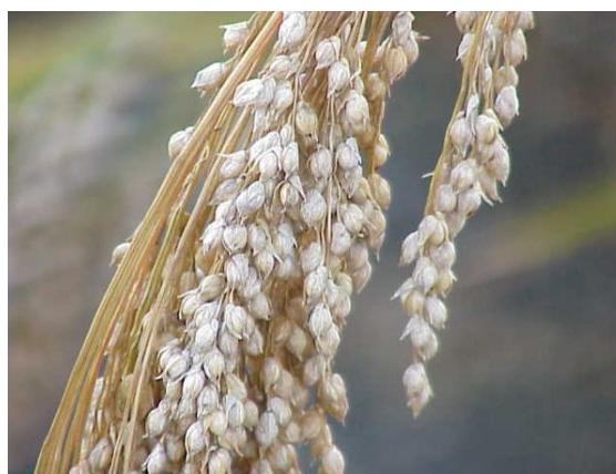
Panicule de millet à maturité

Les cinq céréales les plus cultivées dans le monde sont dans l'ordre le maïs, le blé, le riz, l'orge et le sorgho.