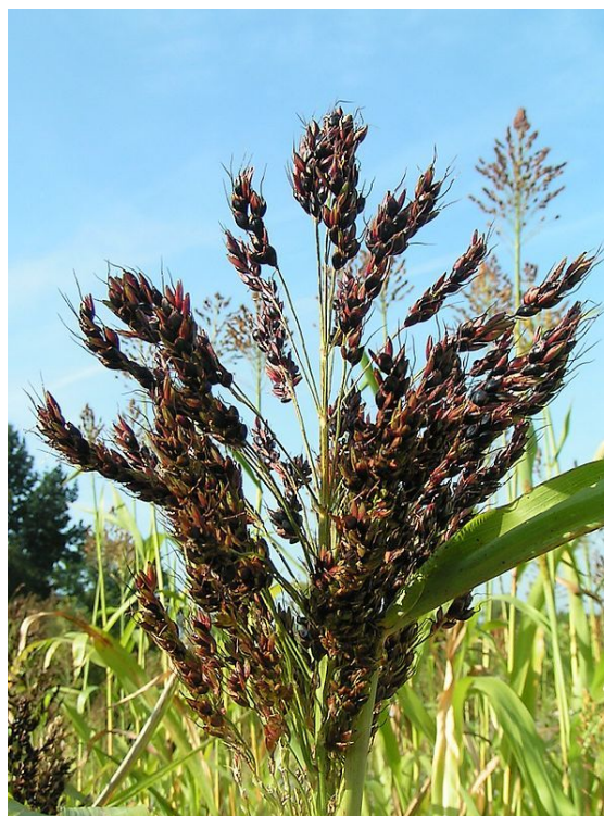
Le sorgho, Sorghum bicolor