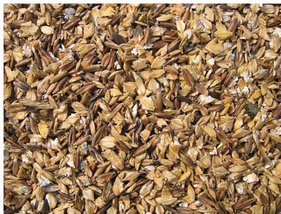
Céréales aplaties employées comme nourriture pour le bétail

Une grande partie de la production mondiale est destinée à l'alimentation des animaux d'élevage : pour les pays développés, 56 % de la consommation de céréales sont des-