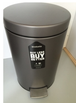
Poubelle tout type de déchets

Verre => le container à verre est à 200 m dans le lieu-dit (haut du village).