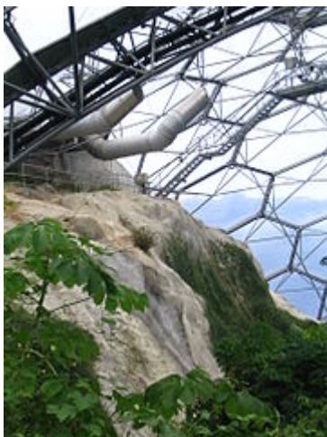
Intérieur du « Biome Tropical »

Les cinq dômes à structure géodésique abritent un ensemble d'espèces végétales organisées le long d'un parcours paysager