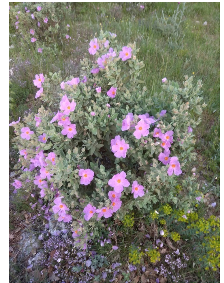
Cistes cotonneux ( Cistus albidus )