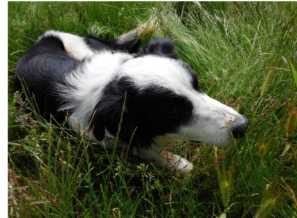
Lucky, un border collie et chien de conduite

Le peu que je sais de la biographie de Lucky est que durant ses 2 premières années, il a été un chien de compagnie, avant de devenir un chien de travail, ce qui n'est pas un itinéraire recommandé pour une border collie. Alors que l'itinéraire normal pour un chien de travail serait de lui offrir une retraite agréable de chien de compagnie, quand il devient vieux, pour le récompenser de ses bons et loyaux services.