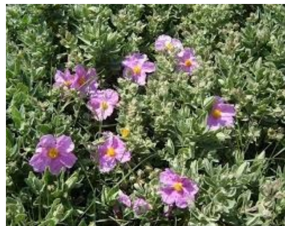
Cistes cotonneux ( Cistus albidus )