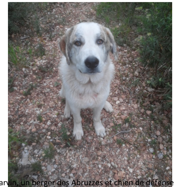
Marvin, un berger des Abruzzes et chien de défense

J'ai tendance à croire que la cohabitation avec des animaux aide à humaniser les êtres humains et je suppose que si Hitler avait été occupé à garder les moutons, durant sa jeunesse, il serait possible qu'il ne serait-il pas devenu ce psychopathe effrayant, ayant ravagé l'humanité et provoqué directement ou indirectement la mort de 60 millions d'êtres humains.