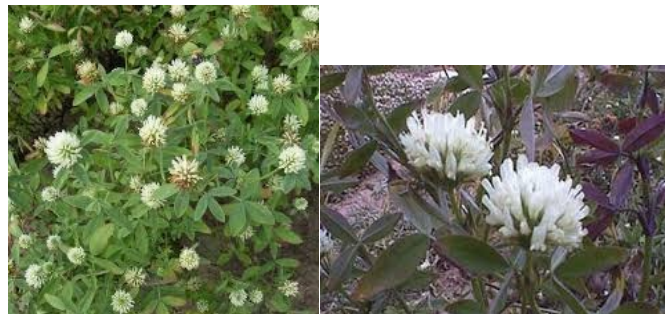
Trèfle d'Alexandrie ou Trèfle incarnat