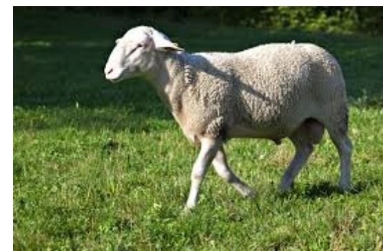
Préalpes du Sud