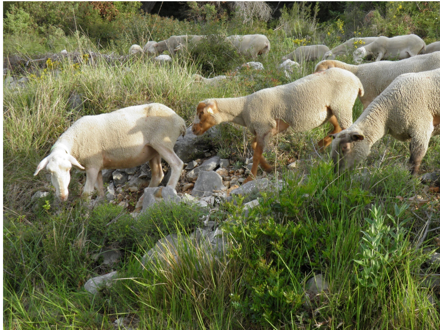
Du 23 mai au 13 juin 2016, dans le massif de la Sarrée puis sur le plateau de Calern, dans l'arrière-pays grassois (Photos : Benjamin Lisan).