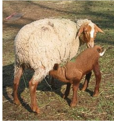
Mourerous ou « Péone »