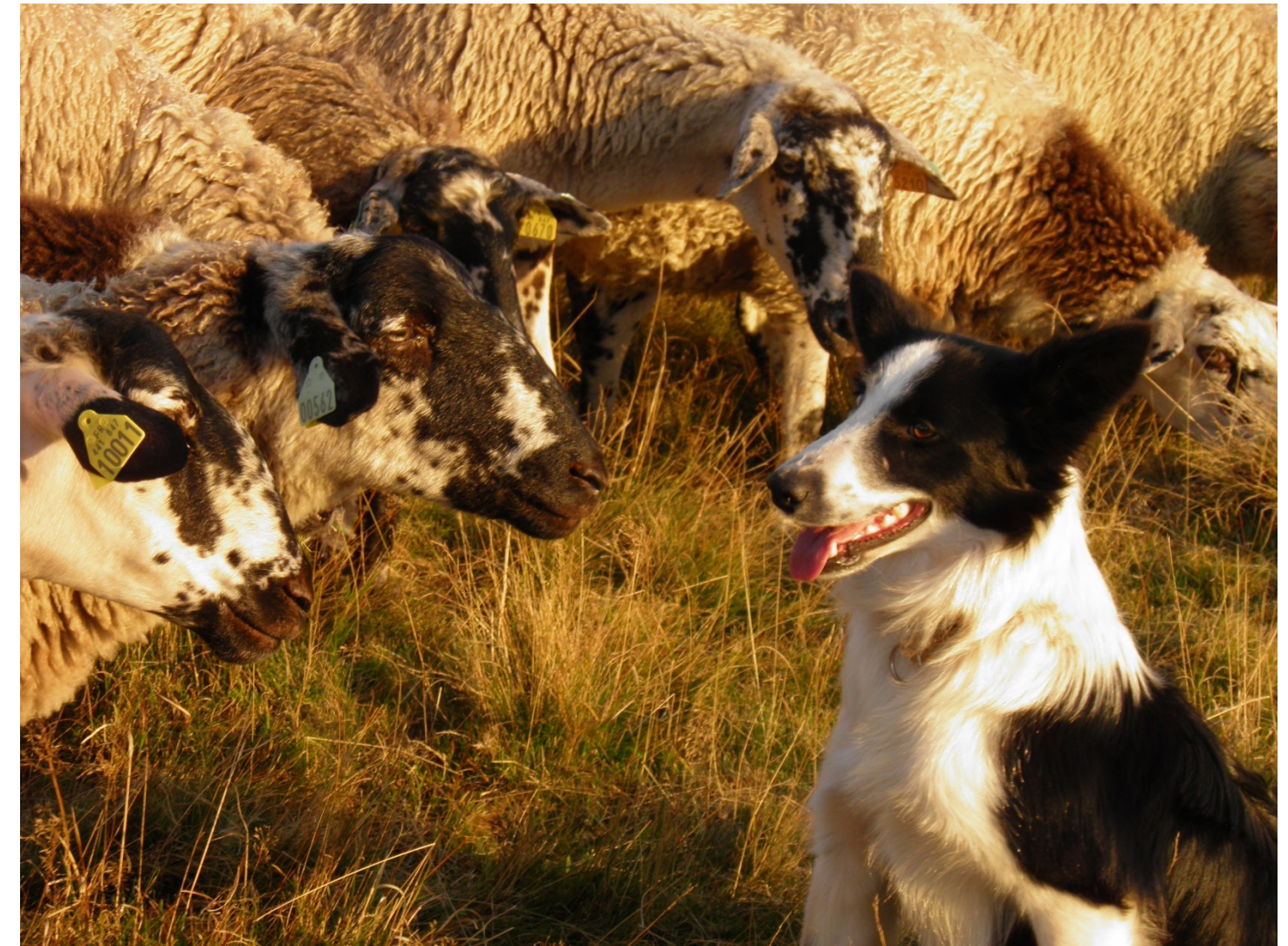
Pollux, chien de conduite.