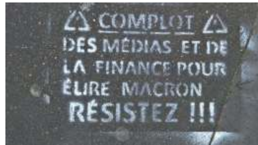
« Complot des médias et de la finance pour élire Macron. Résistez !!! ».