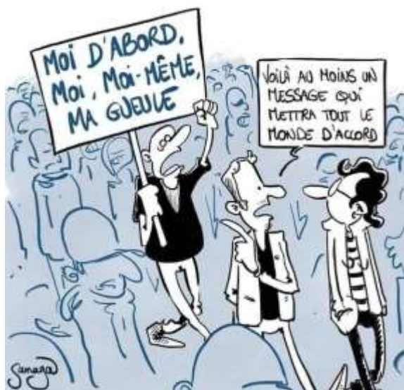
« Moi d'abord, moi, moi-même, ma gueule. Voilà, au moins, un message qui mettra tout le monde d'accord ».

Selon la constitutionnaliste, Anne-Charlène Bezzina, la mesure du passe sanitaire est légale, par rapport à la constitution, eu égard à l'importance de l'impératif de santé 36 .