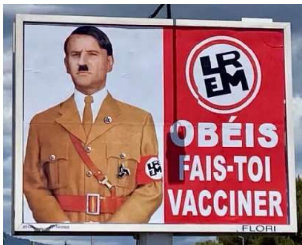
Emmanuel Macron représenté en dictateur, sur une affiche 5 .