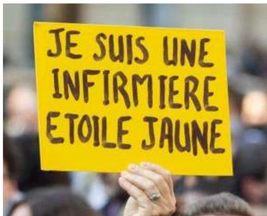
« Je suis une infirmière étoile jaune ».