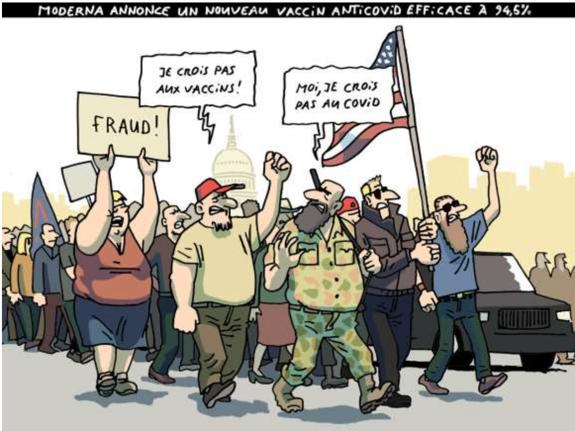
Complotisme ou défiance antivaccinale. © Gérald Hermann (Suisse).