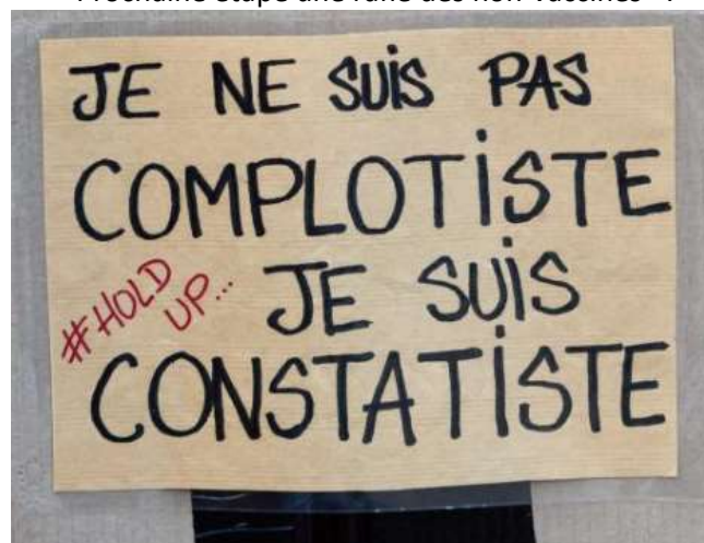
Je ne suis pas complotiste, je suis constatiste. #Hold Up.