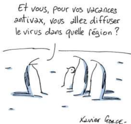
« Et vous, pour vos vacances antivax, vous allez diffuser le virus dans quelle région », Xavier Gorce.