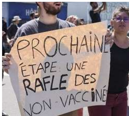
« Prochaine étape une rafle des non-vaccinés ».