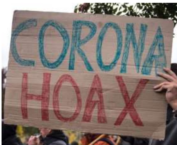
Coronavirus = Hoax (Canular).