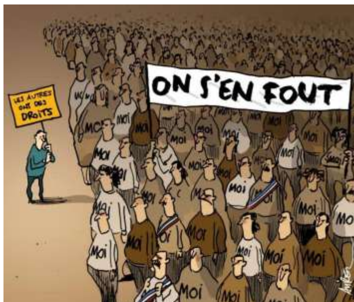
« - Les autres ont des droits. - On s'en fout. Moi, moi ».