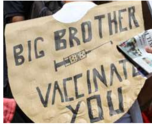
« Big brother vaccinate you ».

Dans la vision complotiste, une oligarchie financière et politique contrôle tous les médias en France, dans le but de faire élire leur créature et marionnette, le Pr. Emmanuel Macron.