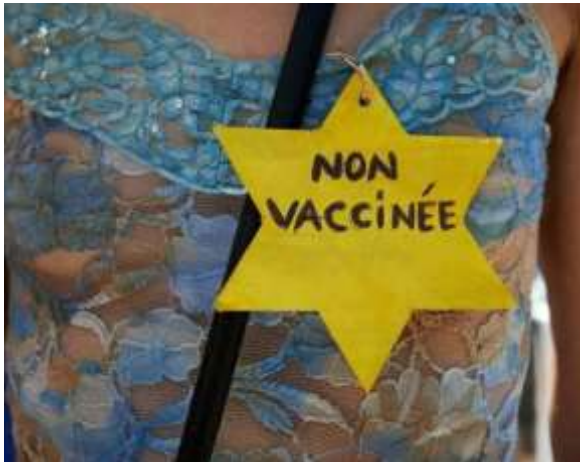
Etoile jaune « non vacciné »

Ces manifestants crient « Liberté ! », pourtant en toute liberté 4 (!).