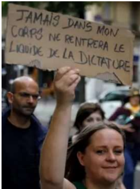
« Jamais dans mon corps ne rentrera le liquide la dictature ».