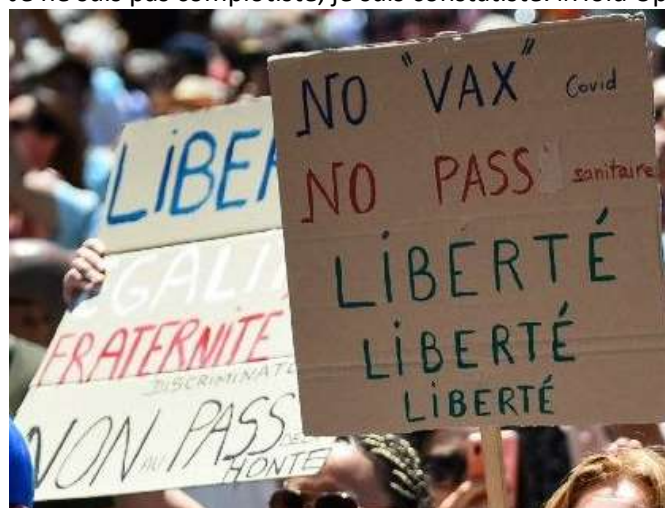
« No "vax" covid, No pass sanitaire, Liberté, libéré, liberté ».