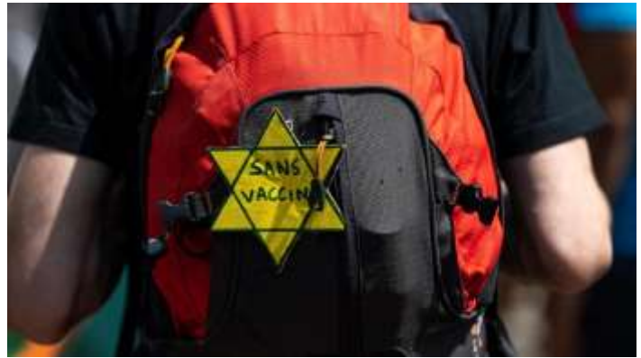
Etoile jaune « sans vaccin »