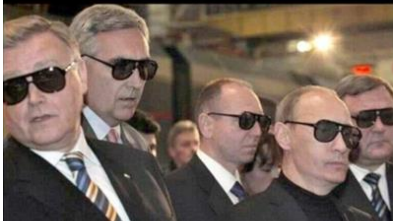
"Chaque pays a sa mafia, mais en Russie, la mafia a le pays", anonyme.

У всех стран есть своя мафия, и только в России у мафии есть своя страна.