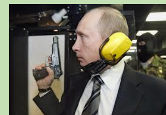
V. Ancien officier du KGB à l'entraînement au pistolet

Leur mégalomanie est telle qu'ils ont besoin de faire croire qu'ils sont surhumains. Et ses fidèles finissent par le croire. Et eux-mêmes idem.