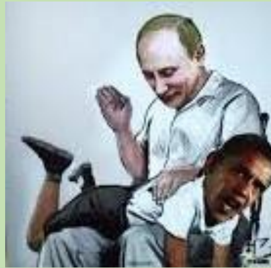
Dernière œuvre d'Art Pro-Poutine le montrant fessant Obama, lors d'une exposition intitulée "Pas de Filtres", à Moscou (Nov 2014), tableau exposé dans une exposition organisée par les jeunes du parti « Russie Unie ».

http://newslanc.com/2014/06/30/growing-of-the-putins-personality-cult/