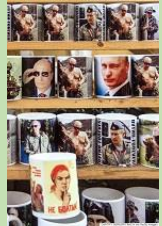
Mugs (tasses) à l'image de Poutine à un marché aux puces à Moscou, le 24 janv 2015 (Dmitry Serebryakov/AFP/Getty Images), http://www.huffingtonpost.com/2015/05/09/shirtless-putin-history_n_7245870.html