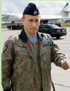
V. Pilote de bombardier