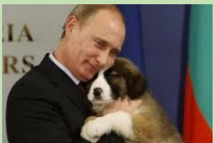
V. « calin »