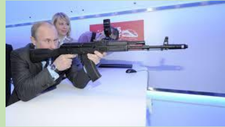
V. Chasseur et tireur d'élite. On y dénote son goût pour les arme.