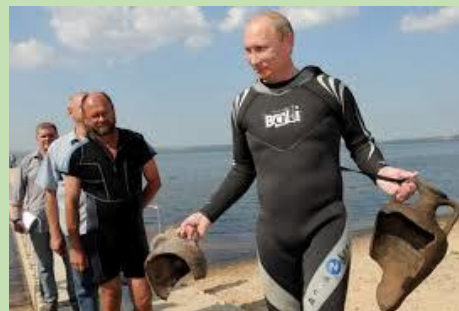
V. Archéologue sous-marin