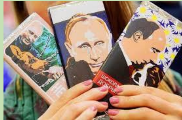
En Russie, portrait de Poutine sur l'emballage des paquets de chocolats

https://cathyyoung.wordpress.com/2006/02/20/russia-everything-old-is-new-again/