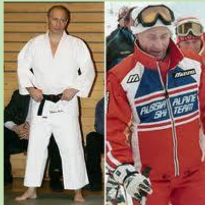
V. Judoka et au ski