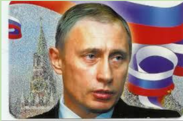
calendrier de poche de Poutine, orné de paillettes, de tours du Kremlin, et de bannières gonflées.

On retrouve ce besoin de pouvoir absolu, ce refus de toute critique personnelle, d'être adulé et être admiré, indéfiniment, et d'avoir ses ouailles, ses fidèles totalement sous sa coupe, chez tous les dictateurs (ou apprentis ou futurs dictateurs), comme Poutine, Erdogan, Xi Jiping, Hitler, Mussolini, Mahomet, Qin Shi Huangdi, Tamerlan, Gengis Khan, Napoléon ... Pour imposer leur dictature, tous les moyens sont bons, y compris les mensonges et désinformation, à haute dose, jusqu'à finir à croire à leur propres mensonges.