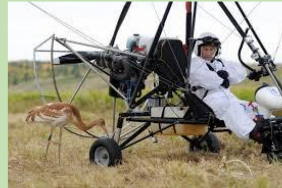
V. pilote d'ULM