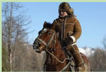
V. montant un cheval l'hiver