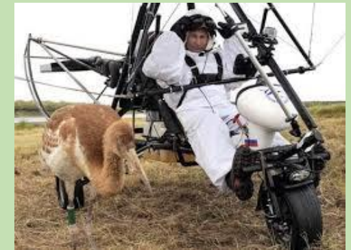
Poutine pilote d'ULM