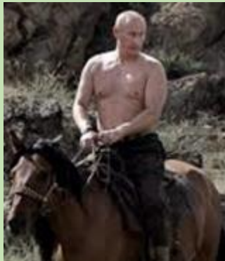
V. montant un cheval, l'été