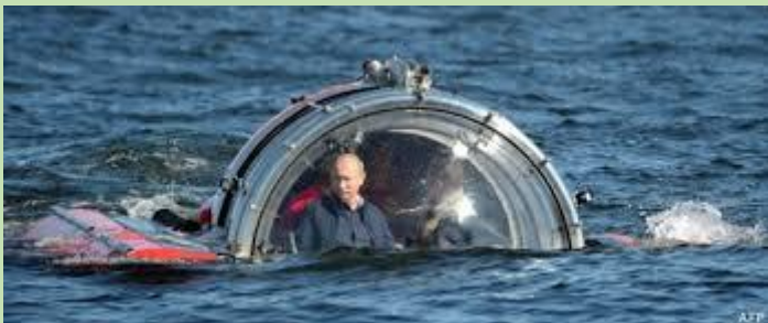
V. Pilotant un submersible