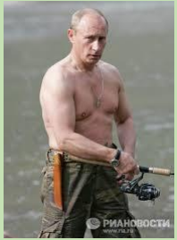
V. à la pêche

Culte de la personnalité : Comme tous les dictateurs, il n'échappe pas à la règle, en instaurant un culte à sa personne. Si l'on croit ces photos, il pratiquerait tous les sports (tel le Duce en Italie, qui était aussi adepte de tous les sports).