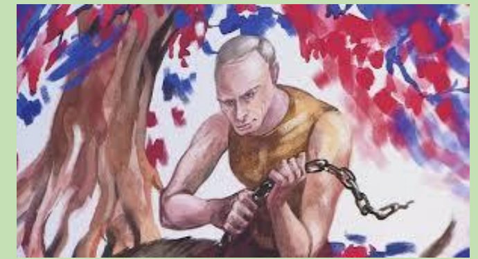
Exposition les 12 travaux de Poutine.

http://nymag.com/daily/intelligencer/2014/11/new-putin-art-exhibit-shows-him-spanking-obama.html