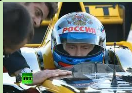
V. pilote de F1