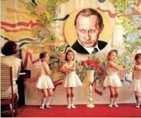
Petites filles russes effectuant une danse sous un portrait de Poutine.