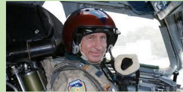
V. pilote de bombardier