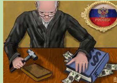
La justice russe est extrêmement corrompue.