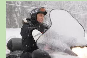
V. pilotant sa motoneige