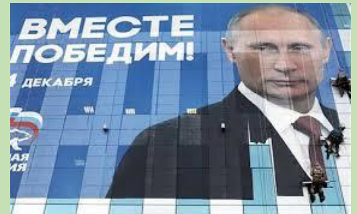
Russie unie? Le parti de Vladimir Poutine a remporté l'élection de dimanche, grâce à un « vote contrôlé ».