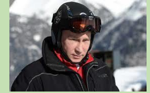
V. Faisant du ski