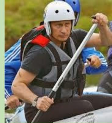
V. Faisant du rafting