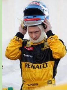
V. pilote de F1