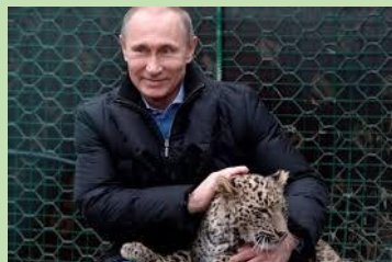
V. « calin »