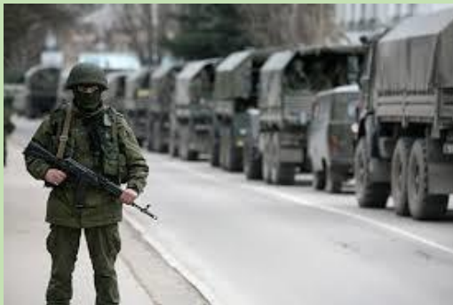
Convoi russe vers la frontière ukrainienne, fin février 2014,

La rhétorique du " complot occidental " relayée tous les jours par les médias russes aux ordres de Poutine et les discours de Poutine n'a rien à voir avec la lutte des classes ou la lutte contre l'impérialisme US ou Européen. C'est, en fait, une rhétorique ultranationaliste. On retrouve la même rhétorique sur un complot occidental dans les pays arabo-musulmans. Ca fait partie de leur guerre idéologique contre l'Occident (devenu, par le tour de passe-passe de leur propagande, un Occident ennemi).