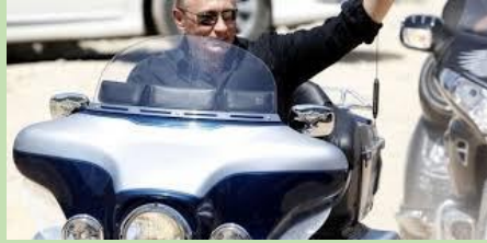
V. pilotant sa moto