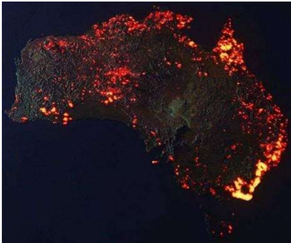
Visualisation des feux en Australie, compilée, par Anthony Hearsey 5 , à partir des données satellite FIRMS de la NASA (données satellites concernant les incendies) entre le 05/12/19 et le 05/01/20 (soit durant un mois).

Donc une question : est-on sûr que ces pyromanes ont aussi exercé leurs pouvoirs de nuisances dans ces zones les plus inaccessibles, dont le Désert de Gibson ? Ou bien ces feux, dans ces zones, auraient-ils une autre cause ? (Orage sec ...) .