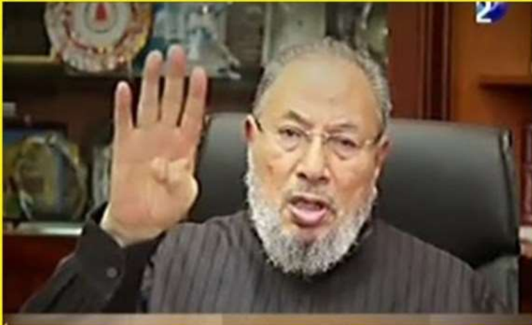
La main du Tamkine de Youcef Al Qaradawi