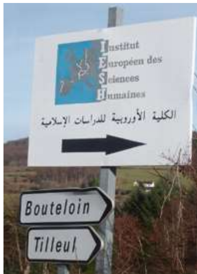
Institut Européen de Sciences Humaines.

Dans le petit village de Saint-Léger-de-Fougeret, à neuf kilomètres de Château-Chinon, se niche l'Institut Européen des Sciences Humaines (IESH) 108 , une école de formation des imams, créée dans les années 90, sous l'impulsion de l'UOIF (Union des Organisations Islamiques de France) et avec l'aide de Danièle Mitterrand.