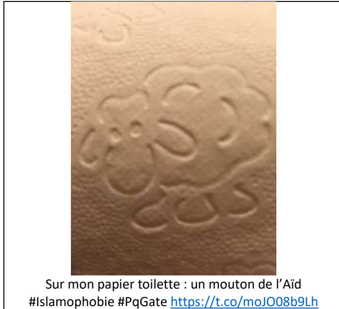
Sur mon papier toilette : un mouton de l'Aïd #Islamophobie #PqGate https://t.co/moJO8b9Lh